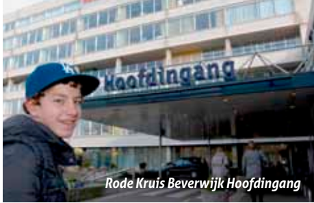
Rode Kruis Beverwijk Hoofdingang